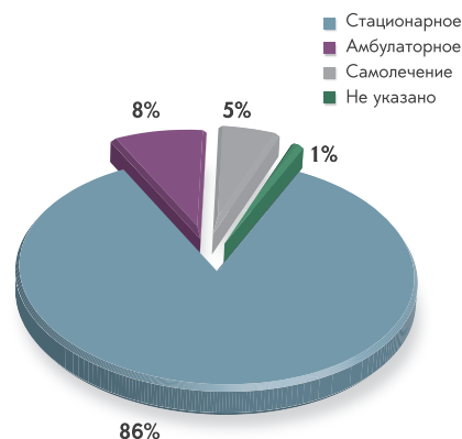
Рисунок 2. Распределение сообщений с МО в зависимости от этапов оказания медицинской помощи

Как видно из таблицы 1, самой частой ошибкой является назначение антибиотика при отсутствии к нему показаний, либо по незарегистрированному показанию. Данный вид МО составляет более трети всех случаев (35,9%) ошибочного применения антибактериальных препаратов. При этом в 60,0% из этих случаев АБП использовали для лечения вирусных заболеваний: в 132 сообщениях (55,0%) – при ОРВИ, в 5 (2,1%) – для лечения больных с аденовирусной инфекцией, в 4 (1,7%) – с целью терапии других вирусных инфекций (без дополнительных уточнений), в 3 случаях (1,3%) – при инфекционном мононуклеозе. В настоящее время доказано, что превентивное назначение антибиотиков при вирусных заболеваниях не предотвращает возможность развития бактериальных осложнений, но при этом чревато формированием устойчивости бактерий к данным противомикробным лекарственным препаратам [8]. Кроме того, использование антибиотиков в подобных случаях при сомнительной их эффективности может сопровождаться развитием нежелательных реакций (в частности, аллергических), что приводит к неблагоприятному соотношению польза/риск такого лечения. Результаты нашего исследования показали, что из 132 случаев использования антибиотиков группы цефалоспоринов при ОРВИ у 61 пациента